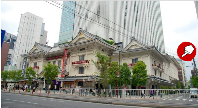
場所 歌舞伎座 右隣5階