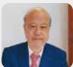
医学博士 中村 健二

製品仕様 バッテリー容量:500mAh 充電電圧:5V 水タンク容量:17ml 製品重量:76g サイズ:127x40x23.5mm