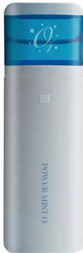
NEW パワーミストO 4 ポータブル加湿器 オープン価格